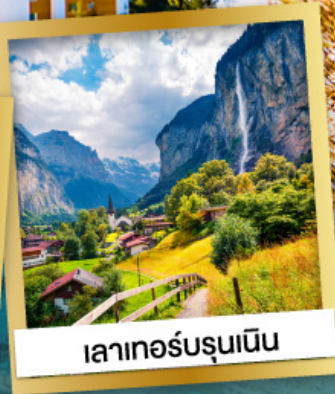
เลาเทอร์บรุนเนิน