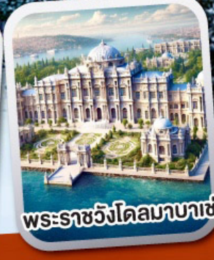
พระราชวังโดลมาบาเซ่