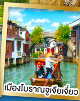
เมืองโบราณซูเจียเจี้ยว