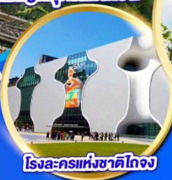
โรงละครแห่งชาติไทจง