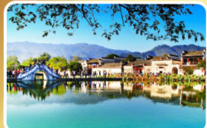
หมู่บ้านผดกโลก หงซุน