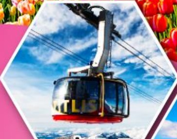
กระเช้าที่ตลีส