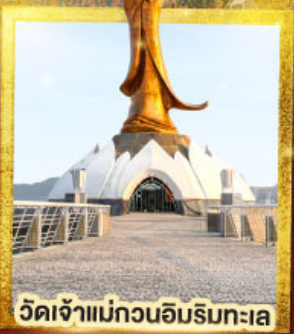
วัดเจ้าแม่กวนอิมริมทะเล