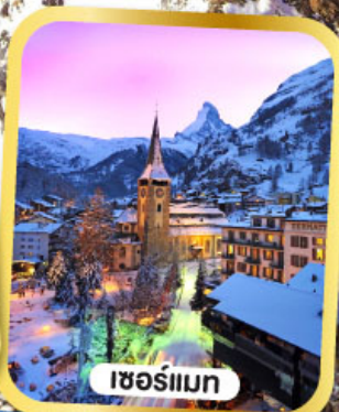
เซอร์อแมท