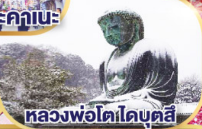
หลวงพ่อดโตโดบตล