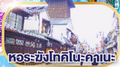
หอรซงทคคโนะคานะ