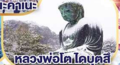
หลวงพ่อดโตโดบุตสึ