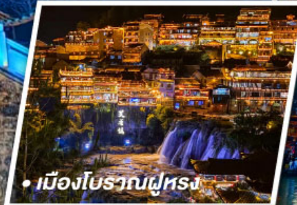
• เมืองโบราณฉู่หลิง