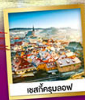
เซสท์ครุมลอฟ