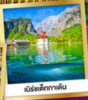
เบิร์ชติ๊กกาเดิน