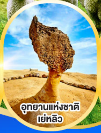
อุทยานแห่งชาติ เยหลิว