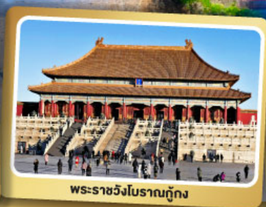
พระราชวังโบราณกู้กง