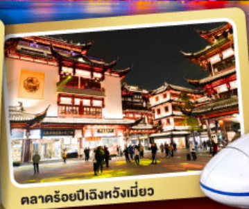
ตลาดร้อยปีเฉิงหวงเหมียว