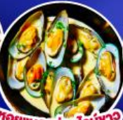
หอยแมลงภู่อบไวน์ขาว