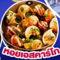
หอยเอสคาร์โท

เดินทาง 17-25 ก.ย.67/11-19,18-26 ต.ค.67 14-22 พ.ย.67/30 พ.ย.-8 ธ.ค.67 25 ธ.ค.67 - 2 ม.ค.68(เทศกาลปีใหม่)