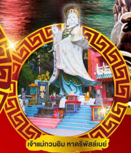
เจ้าแม่กวนอิม หาดริฟส์เบย์