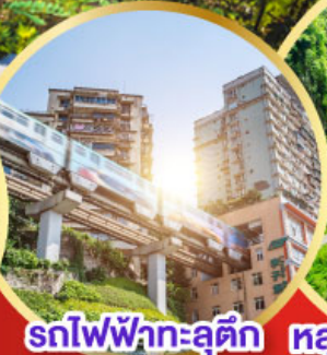
รถไฟฟ้าทะลุคิก หลุมฟ้าสะพานสวรรค์