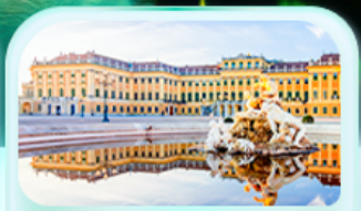
พระราชวังเซินบรุนน์