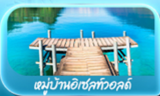
หมู่บ้านอิเชิลทออลด์