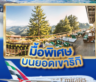
มือพิเศษ บินยอดเขารัก