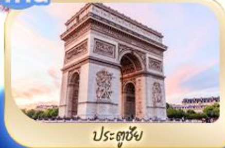
ประตูชัย