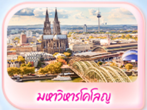
มทาวินทาร์โคโลญ