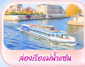
คลองเรือแม่น้ำแซน