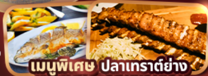
เมนูพิเศษ ปลาเทราต์ย่าง Ribs Of Vienna (1 rack 500g)