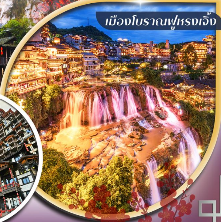
เมืองโบราณฝูหลงเจิ้ง

คอนเฟิร์มออกเดินทาง ตั้งแต่ 10 ท่าน ขึ้นไป