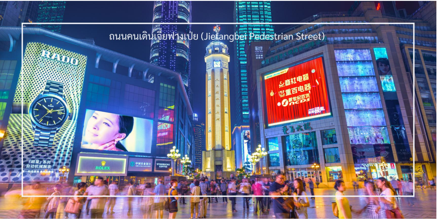
ถนนคนเดินเจียงเป่ย์ (Jiefangbei Pedestrian Street)