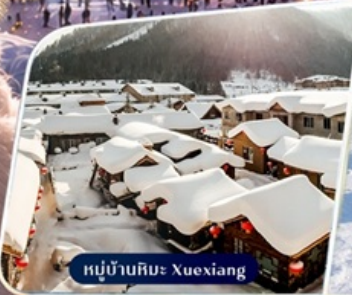
หมู่บ้านหิมะ Xuexiang