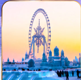
เทศกาลแกะสลักน้ำแข็ง Harbin Ice and Snow Festival