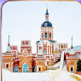
คฤหาสน์วอลการ์