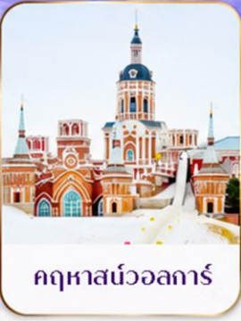
เทศกาลแกะสลักน้ำแข็ง Harbin Ice and Snow Festival