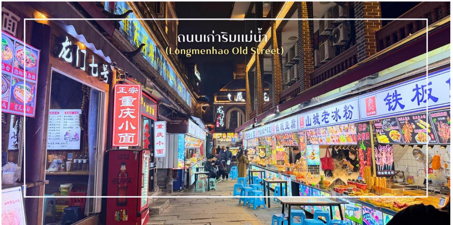
ถนนเก่าริมแม่น้ำ (Longmenhao Old Street)

เย็น บริการอาหารเย็น ณ ภัตตาคาร (มือที่ 9) เมนูพิเศษ : สุกี้หม่าล่า