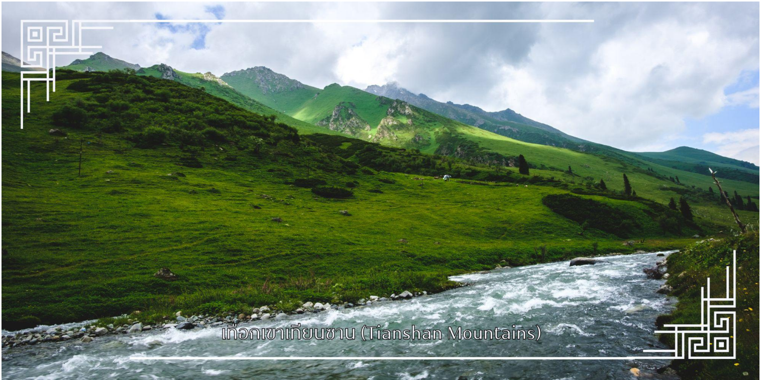
เทือกเขาเทียนชาน (Tianshan Mountains)