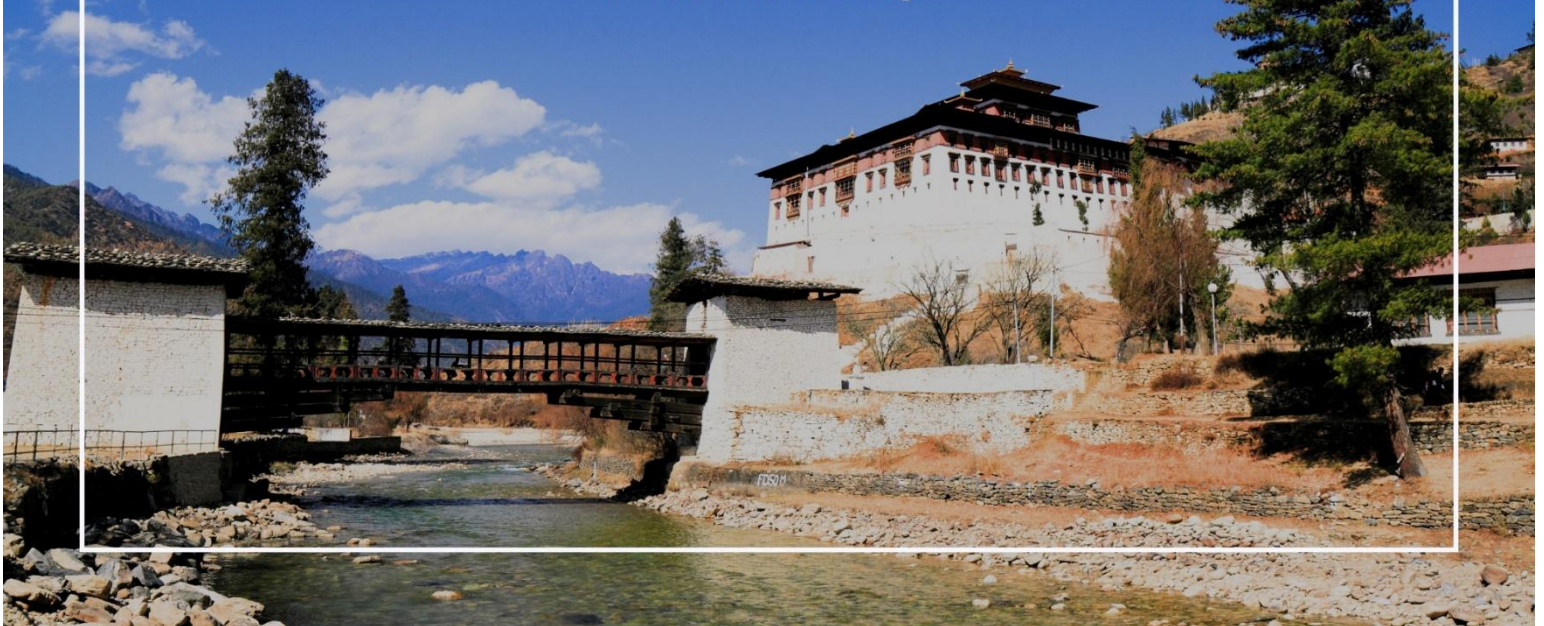
พาโรซอง (Paro Dzong)

เที่ยวชม พาโรซอง (Paro Dzong) เป็นหนึ่งในสถาปัตยกรรมที่สำคัญและสวยงามที่สุดในภูฏาน ตั้งอยู่ในเมืองพาโร (Paro) และมีบทบาทสำคัญทั้งในด้านศาสนาและการปกครอง สร้างขึ้นในปี 1646 เพื่อใช้เป็นที่ทำการของรัฐบาลและวัดประจำเมือง พาโรซองเป็นสัญลักษณ์ของความเข้มแข็งและความเป็นอิสระของภูฏาน