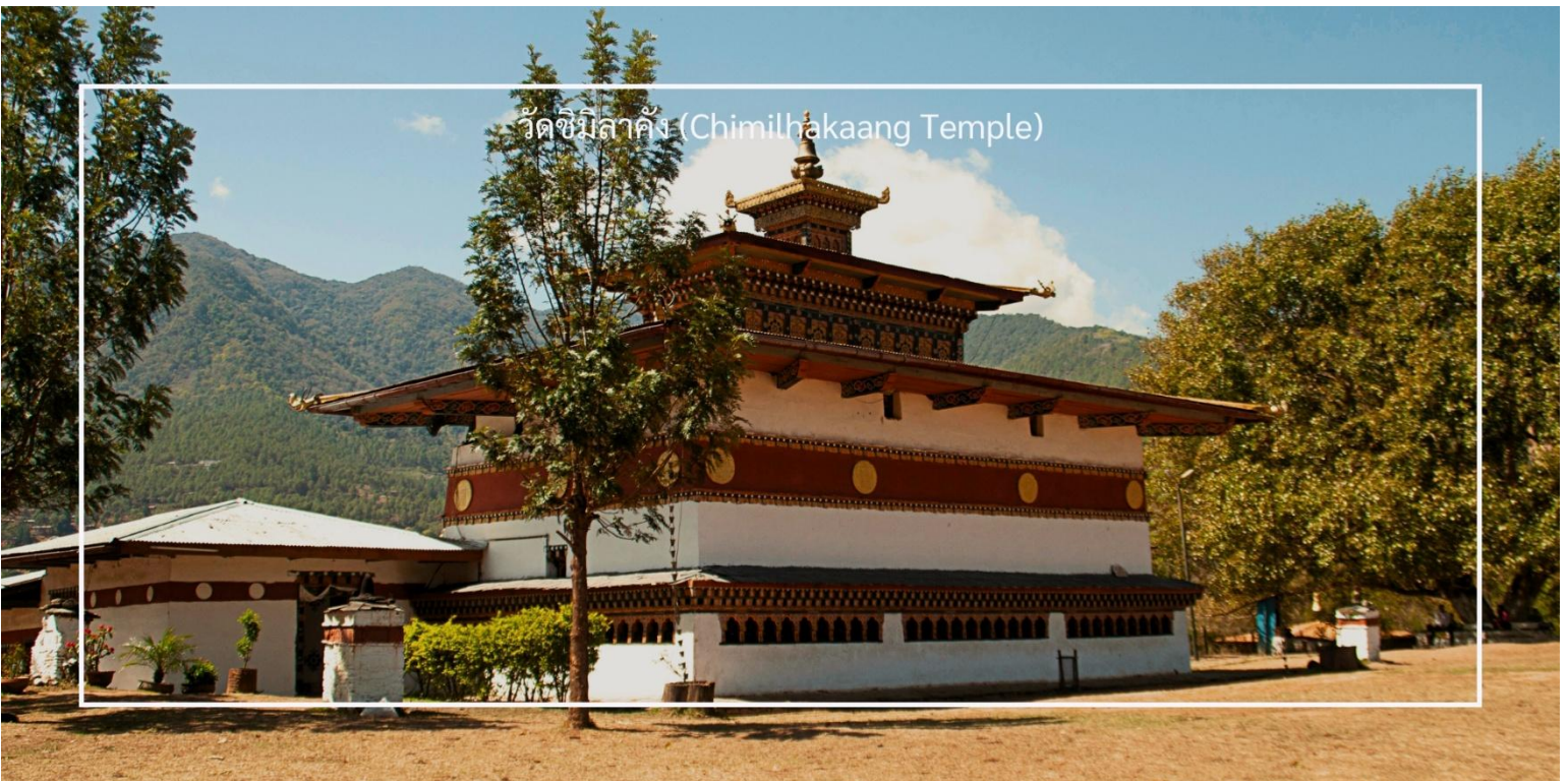
วัดชิมิลาคัง (Chimilhakaang Temple)

เที่ยงชม วัดชิมิลาคัง (Chimi Lhakhang Temple) หรือที่เรียกว่า "วัดแห่งพระเจ้าแห่งความรัก" เป็นวัดที่สำคัญในภูฏาน ตั้งอยู่ในเมืองทิมพู และเป็นที่รู้จักในด้านการเป็นสถานที่สักการะของพระเจ้าแห่งความรักและความสุข มีประวัติศาสตร์ยาวนานและมีความสำคัญในด้านศาสนา โดยสร้างขึ้นเพื่อเป็นที่สักการะและบูชาพระเจ้าแห่งความรัก ซึ่งเป็นสัญลักษณ์ของความรักและความสุขในชีวิต มีการออกแบบในสไตล์ภูฏานดั้งเดิม มีลวดลายและสีสันทที่สวยงาม โดยเฉพาะการตกแต่งภายในที่เต็มไปด้วยงานศิลปะและภาพวาดทางศาสนา นอกจากนี้ท่านยังจะได้พบเห็นสัญลักษณ์ของความเชื่อความศรัทธาที่ชาวเมืองแห่งนี้เชื่อว่าเป็นส่วนหนึ่งของความรัก