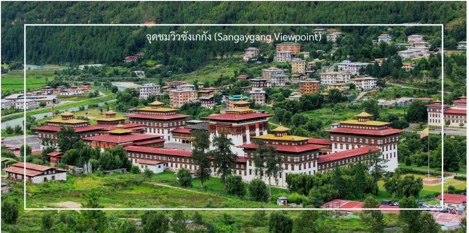
จุดชมวิวซังแก๊ง (Sangaygang Viewpoint)

เที่ยวชม จุดชมวิวซังแก๊ง (Sangaygang Viewpoint) เป็นหนึ่งในจุดชมวิวที่สวยงามในเมืองทิมพู (Thimphu) ตั้งอยู่บนเนินเขาที่สูง ทำให้ผู้เข้าชมสามารถมองเห็นทิวทัศน์ทั้งดงามของเมืองทิมพูและภูเขารอบๆ จุดชมวิวนี้นี้มีทิวทัศน์ที่สวยงามของเมืองทิมพูและเทือกเขาหิมาลัย โดยเฉพาะในวันที่อากาศแจ่มใส นักท่องเที่ยวสามารถเห็นวิวที่กว้างไกลได้อย่างชัดเจน