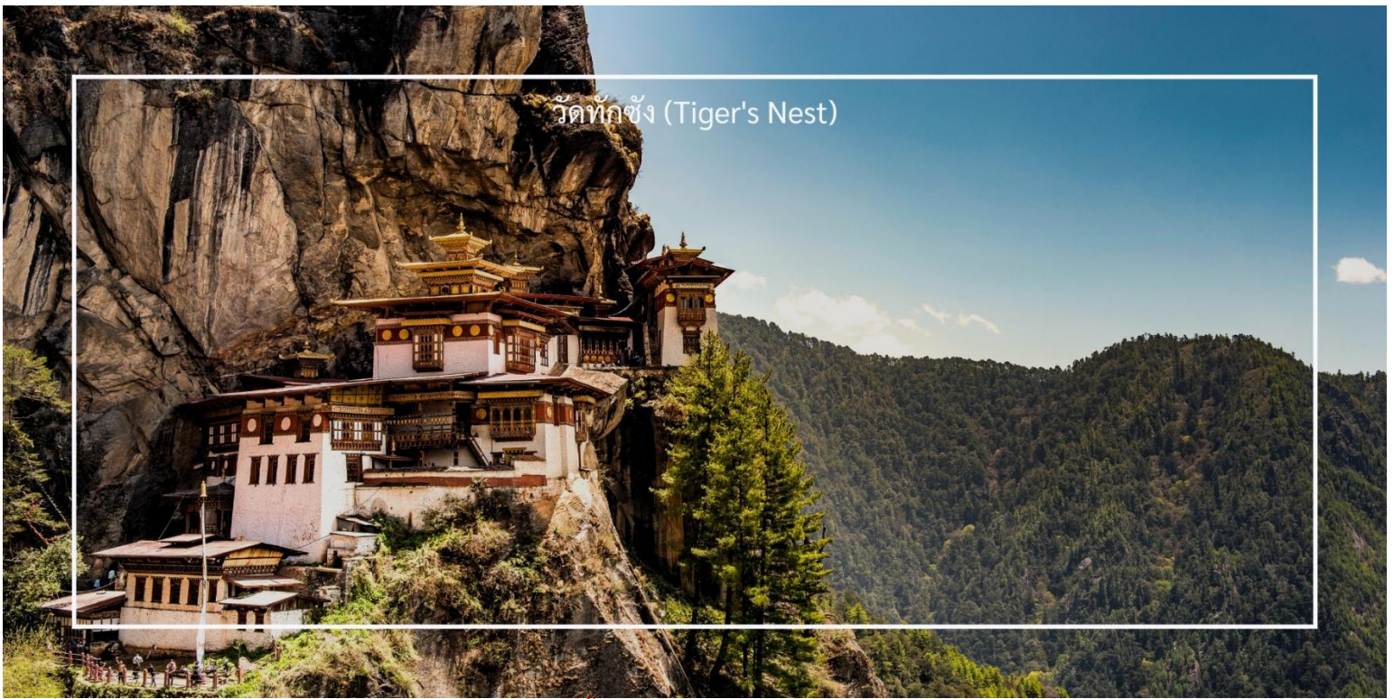
วัดทักซัง (Tiger's Nest)