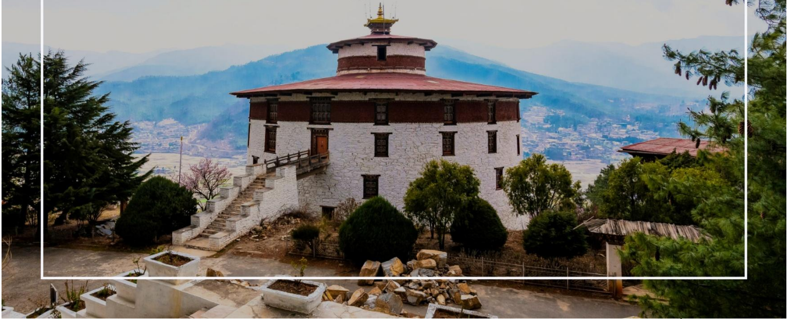
พิพิธภัณฑ์สถานแห่งชาติภูฏาน (National Museum of Bhutan)

เที่ยวชม พาโรซอง (Paro Dzong) เป็นหนึ่งในสถาปัตยกรรมที่สำคัญและสวยงามที่สุดในภูฏาน ตั้งอยู่ในเมืองพาโร (Paro) และมีบทบาทสำคัญทั้งในด้านศาสนาและการปกครอง สร้างขึ้นในปี 1646 เพื่อใช้เป็นที่ทำการของรัฐบาลและวัดประจำเมือง พาโรซองเป็นสัญลักษณ์ของความเข้มแข็งและความเป็นอิสระของภูฏาน