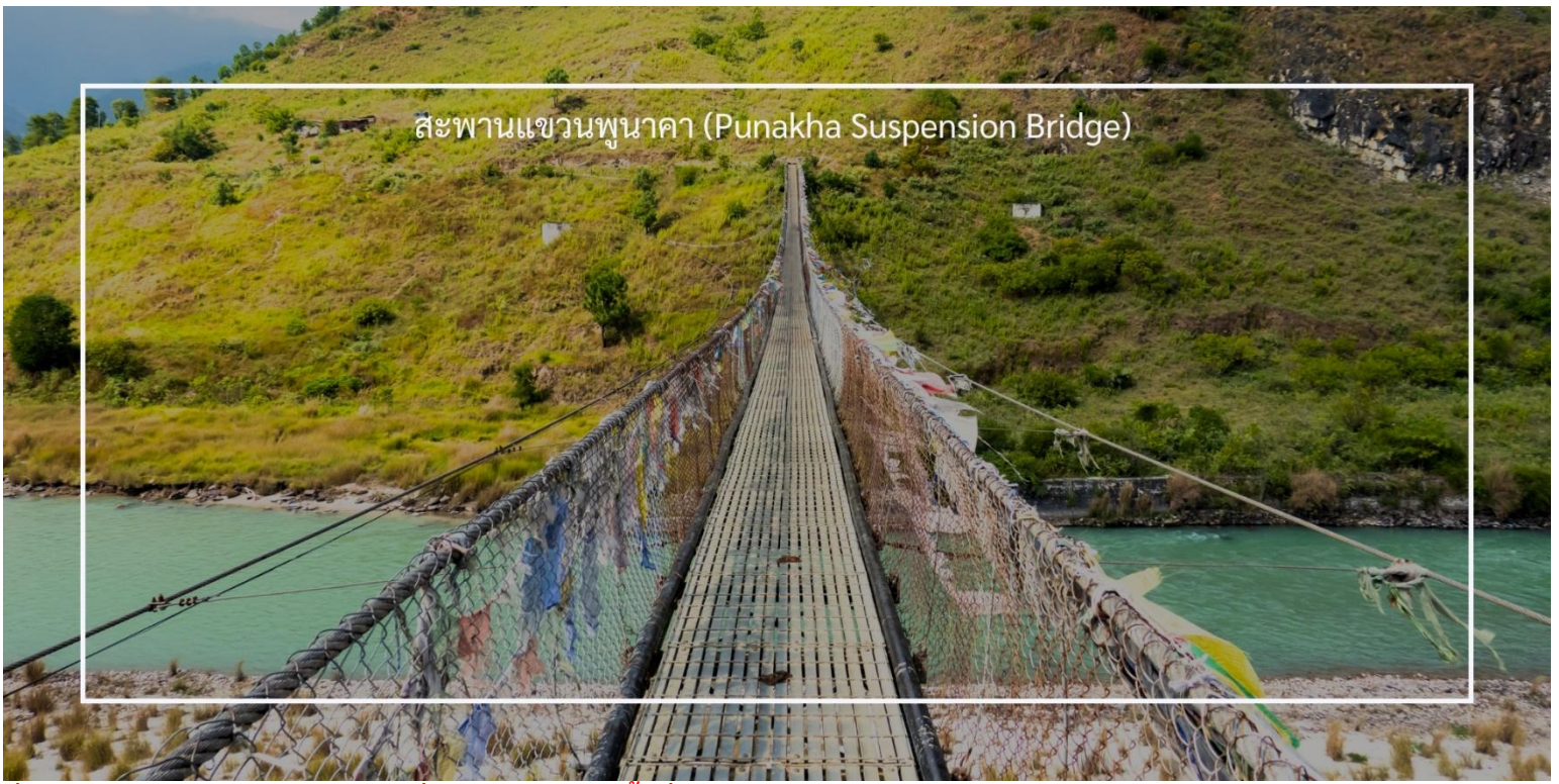
สะพานแขวนพุนาคา (Punakha Suspension Bridge)

ค่ำ รับประทานอาหารค่ำ ณ ภัตตาคาร (มื้อที่ 5)