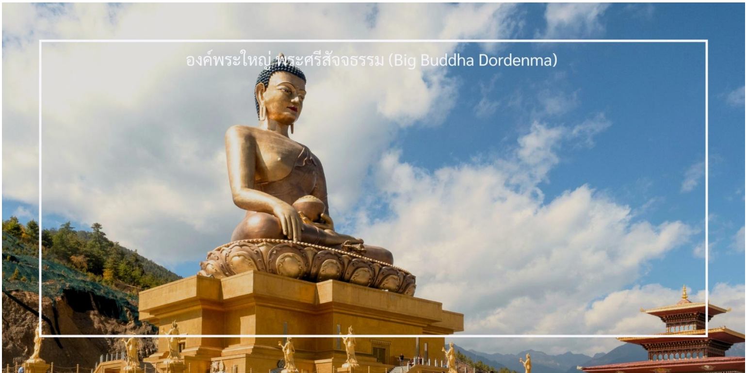
องค์พระใหญ่ พระศรีสัจธรรม (Big Buddha Dordenma)

เที่ยวชม องค์พระใหญ่ พระศรีสัจธรรม (Big Buddha Dordenma) เป็นพระพุทธรูปที่มีความสูงถึง 51 เมตร ตั้งอยู่บนยอดเขาในเมืองทิมพู (Thimphu) ประเทศภูฏาน พระพุทธรูปนี้เป็นหนึ่งในพระพุทธรูปที่ใหญ่ที่สุดในโลก