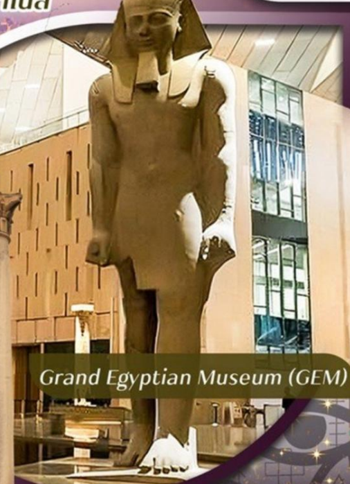
Grand Egyptian Museum (GEM)

คอนเฟิร์มออกเดินทาง ตั้งแต่ 15 ท่าน ขึ้นไป