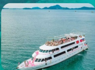
เกาะพีพีทิวรี่