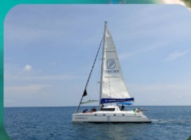
ล่องเรือยอร์ชชมน้ำเค็ม