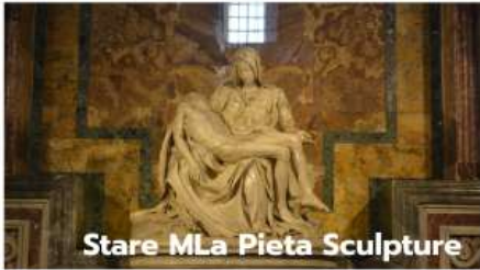
Stare MLa Pieta Sculpture