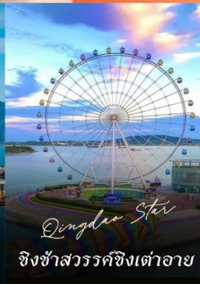
Qingdao Star ชิงช้าสวรรค์ชิงเต่าอาย