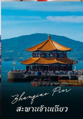
Zhangjiao Pier สะพานจ้านเจียว