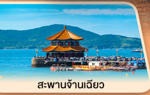
สะพานจ้านเจียว

ชายหาดซาโจ่ว โรงงานเบียร์ชิงต้า ชมทุ่งดอกพื้งค์มอส ชายหาด NO.3