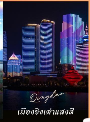
Qingdao เมืองชิงเต่าแสงสี