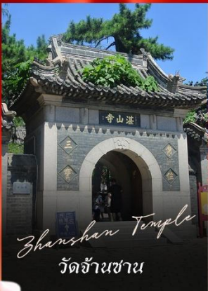
Zhan Shan Temple วัดจันซาน

รายการทัวร์ข้างต้นอาจมีการปรับเปลี่ยนเพื่อความเหมาะสม