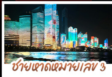
ซ่ามเขาดเมมาเลข 3