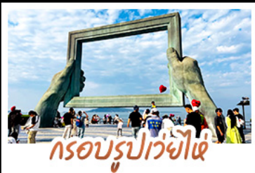
กรอบรูปเว่ยไฉ่

ทำบุญย่านเมืองเก่าสไตน์ยอร์ม • โบสถ์เซนต์ไมเคิล และย่านปาด้ากวน พร้อมทัวร์พิพิธภัณฑ์โรงเบียร์ชิงเต่าระดับตำนาน ฟรี! ซิมเบียร์สดท่านละ 1 แก้ว เช็กอินมมมหาชนฟีลอินนิเม่ที่ถนนคนพลึงสายที่ 8 • แวะทำบุญปู่ศุรอารตกับ ซากเรือลูวู • ตกค่ำตะลุยของกินที่ตลาดสไตน์กาหลี่ ถนนอันเลื่องฟ้าง ที่ชิวอิสระตามใจชอบ จัดสรรเวลาให้ท่านด้วยวัน FREE DAY 1 วันเต็มในชิงเต่า