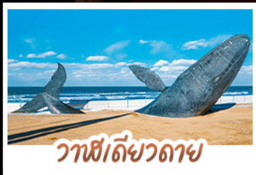
วาฬโต้วถาย