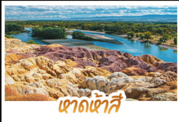
เขาดินสี