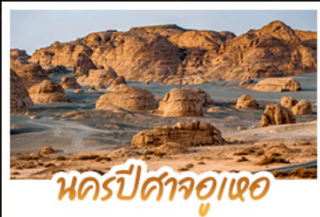
นครปีศาจอู๋เออ

หนาวที่ซินเจียง เราชะลิกความงามสุดอลังการของอุทยานคานาสี เก็บภาพสวยครบทุกพิกัด ทั้งศาลาชมปลา อ่าวสีเขียวจินรา อ่าวซ่อนมิงกร และอ่าวเทพทวดคา • นอนพักค้างคืนในกระท่อมไม้ ภายในหมู่บ้านเหมอู๋ ตื่นเช้ามาสูดอากาศบริสุทธิ์และจับจุดชมวิวนูบ้านที่ถูกหิมะปกคลุมราวกับเมืองในฝัน นั่งรถไฟขบวนวินคริปัสจ้อเหอ • ช้อปปิ้งของฝากที่ตลาดแกรนด์บาซาร์ เมืองอู่ลูบูฉี