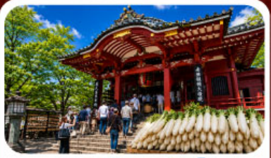
วัดมิตสึงิยามะไซเด็น