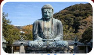
หลวงพ่อดาโตะบุตซึ