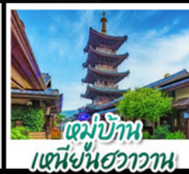
หมู่บ้าน เหมิงหนี่ฮวาวาน