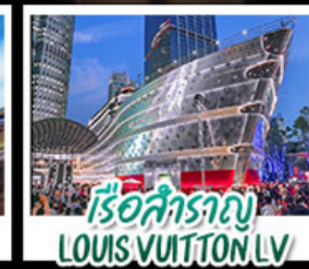
เรือสำราญ LOUIS VUITTON LV