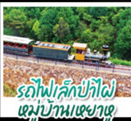
รถไฟเล็กป่าไผ่ หมู่บ้านเหยาหู