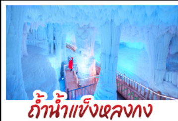
ถ้ำน้ำแข็งหลงทง