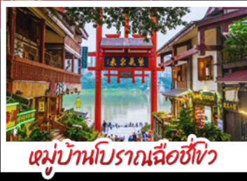
หมู่บ้านโบราณฉือซีโจว