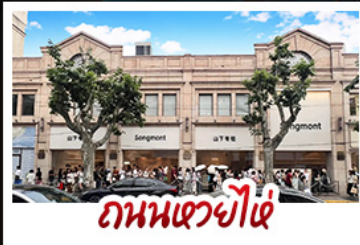
ถนนเซวี่ไผ่