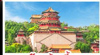
พระราชวังฤดูร้อนอี่เหอหยวน