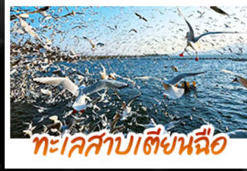
ทะเลสาบไต้ย่นฉือ