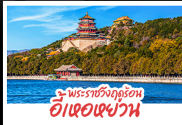
พระราชวังฤดูร้อน ฮ้อเจ๋อเฉงวาน