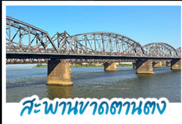
สะพานขาดสถานตง