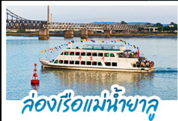
ล่องเรือแม่น้ำชาลู่