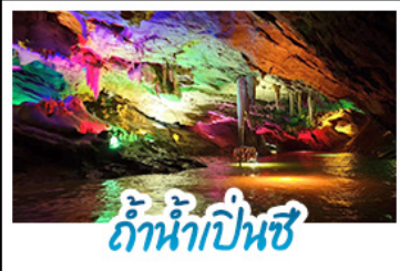
ถ้ำน้ำเปิ่นซี

แกรนด์เสฉีจวหนิง 5 นคร...ชมเวนิสต้าหลุยส์สุดปัง เยือนชายแดนตามตงสุดอลัง ล่องแม่น้ำเป็นซีสุดอลัง ย้อนรอยวังเสฉีหนิงทุกอง