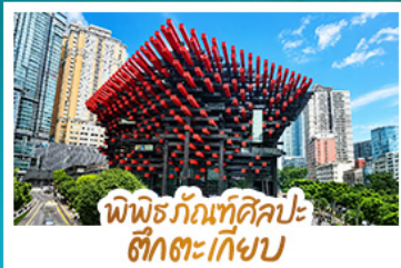
พิพิธภัณฑ์ศิลปะ ฮักตะเกียบ