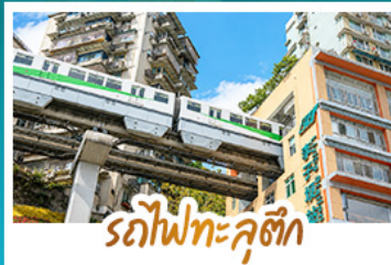
รถไฟทะเลสาบ