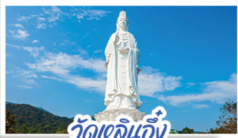
วัดเขลิอัน