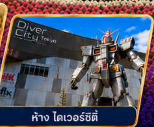
ห้าง ไดเวอร์ซิตี