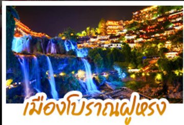
เมืองโบราณฝูเฉิง