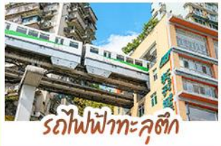
รถไฟฟ้าทะลุคดห้อยป่า

ชมธรรมชาติ ณ อุทยานแห่งชาติหวู่หลง ชมหุบเขาสุดอลังการระดับมรดกโลก นั่งรถไฟฟ้าทะลุคดห้อยป่า สัมผัสกลิ่นเมืองฉิ่งสุดล้ำ สัมผัสวิถีภูเขาหิมะแห่ง ภูเขาสี่ดรุณี งดงามจนได้รับฉายา “เทือกเขาแอลป์แห่งตะวันออก” ชมธรรมชาติสุดฟิน ณ อุทยานปี่ผิงโกว • ซ้อปิ้งจุใจ ถนนคนเดินไท่กู่หลี่, ถนนคนเดินซุนซู่