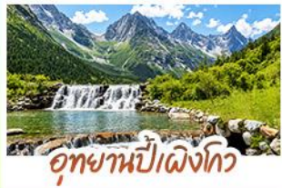
อุทยานปี่ผิงโกว