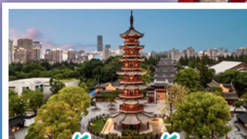
วัดหลงเซ้า