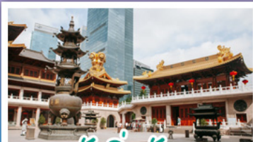
วัดจิ้งอัน

ถนนหยาไห่ - วิวเมืองเซี่ยงไฮ้ - วัดจิ้งอัน วัดพระหยก - วัดหลงหัว