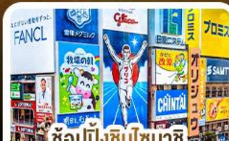
ช้อปปิ้งชินโซบาชิจิ