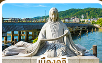
เมืองอูจิ สวรรค์คนรักชาเขียว

คามิโดจิ สวรรค์บนดินแห่งเทือกเขาแอลป์ ชมสะพานคิปปาบาชิ ชมวัดเนียวโดอิน • เมืองทาดายาม่า • ตลาดปลานิชิกิ • ช้อปปิ้งชินโซบาชิ • อีออนมอลล์