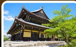
วัดนินเซ็นจิ