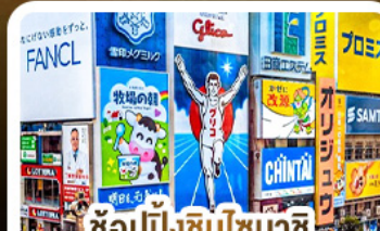
ช้อปปิ้งชินโซบาชิ และโดตงโมริ