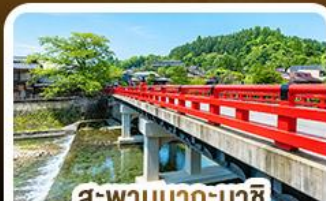
สะพานนากะบาชิจิ